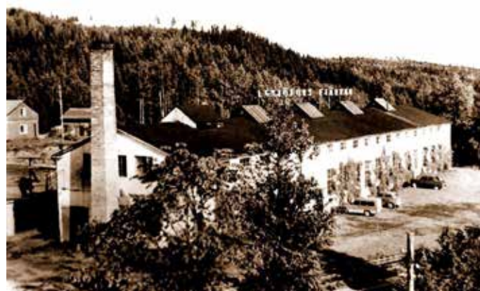
Fjäderfabriken i Lesjöfors.