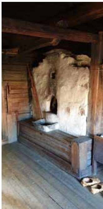
Rökugnen i den skogsfinska rökstugan.

Efter lunch åkte vi till Norsk Folkemuseum, där vi fick en fin visning av både den skogsfinska rökstugan (från Ampiansbråten på Varaldskogen) och av två norska rökstugor. Märkligt nog var de norska rökugnarna mycket mindre än de skogsfinska rökugnarna är, trots att rummen var större.