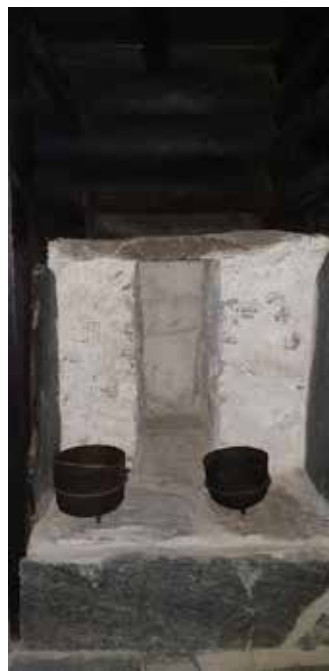
Rökugnen i en av de norska rökstugorna.

På kvällen återsågs vi på Oslos äldsta restaurang i kontinuerlig drift, Cafe Engebret. Här avnjöts lördagens middag under gemytlig samvaro.